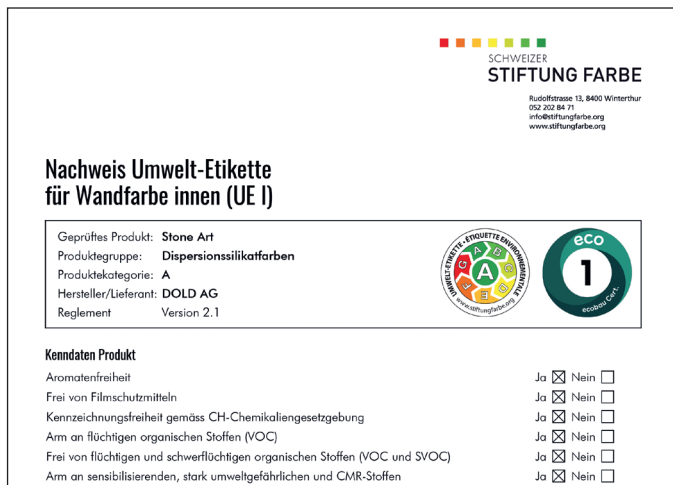
Online-Teilauszug eines nach Umweltstandards gefilterten Nachweises der Umwelt-Etikette für die Farbe Stone Art.

(Dold) Die Dold AG hat ihre Website technisch und inhaltlich komplett überarbeitet und modernisiert. Eine praktische Neuerung ist der Paint Finder, ein digitales Such- und Filtertool, das Anwender gezielt zur passenden Beschichtungslösung führt.