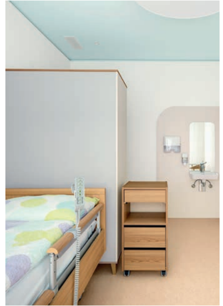
Das Hellblau der Decke öffnet die Zimmer gegen oben.

Die zwei langen Riegel mit einem Verbindungstrakt seien nicht ideal, sagt Andrea Stampfli von der GSJ Architekten AG in Solothurn, die zusammen mit Grego Architektur in Zürich den Wettbewerb für das Projekt gewonnen hat. Normalerweise plane man für solche Einrichtungen kompakte Baukörper mit «Rundläufen» im Innern. Damit lässt sich verhindern, dass kognitiv eingeschränkte Personen plötzlich nicht mehr weitergehen können. Das ist bei Korridor-Enden der Fall und kann Orientierungslosigkeit bis zu Aggressionen auslösen.