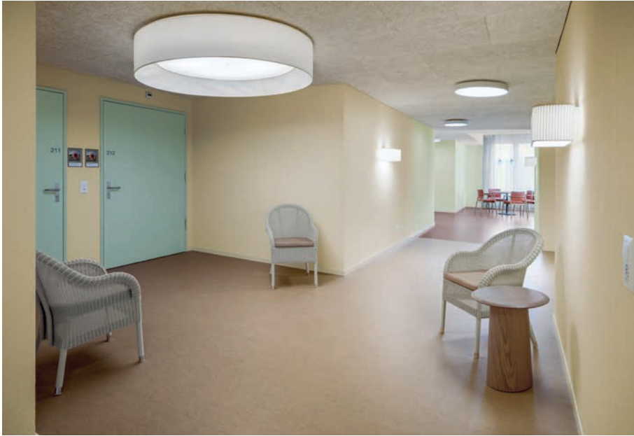
Die Türen zu den Zimmern sind farblich bewusst abgesetzt von den Wänden. Wenn sie geschlossen sind, wirken sie wie Fenster zum nächsten Raum.

Weil die Riegel vorgegeben waren, war Kreativität gefragt. «Wir wollten keine Korridore mit einer Aufreihung von Zimmern, sondern Räume, die sich zu den Korridoren öffnen», erklärt die Architektin. Kurz: Es galt, einen Spitalcharakter zu vermeiden.