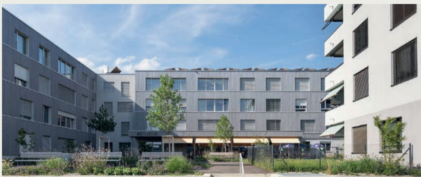
Das Zentrum Hofgarten mit dem zweiflügeligen Wohnheim und dem Turm (rechts).

Küchenchef ist Rolf Caviezel, eine Koryphäe auf dem Gebiet der Disphagie-Küche für Personen die nicht gut oder gar nicht mehr schlucken können. Das vorgekochte und schockgefrorene Essen wird mit mobilen Geräten in die Wohngemeinschaften verteilt, wo es computergesteuert nach individuellem Bedarf der Bewohner zu jeder Zeit schonend aufgewärmt wird, sodass es wie frisch gekocht wirkt. /