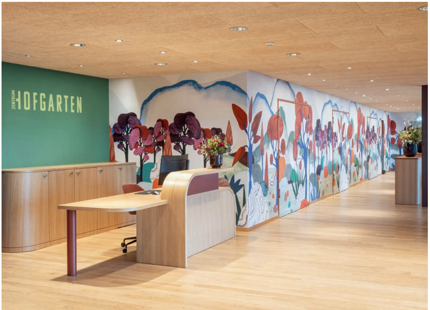
Die Tapete im Bereich des Eingangs und des Restaurants ist ein Hingucker und stellte die Maler vor eine knifflige Aufgabe.