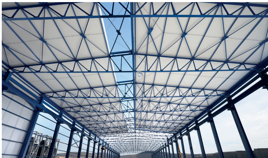
Perfezione nella protezione anticorrosione dell'acciaio

Potete trovare ulteriori informazioni sui nostri siti web oppure in alternativa potete consultare i nostri consulenti specializzati nella vostra regione.