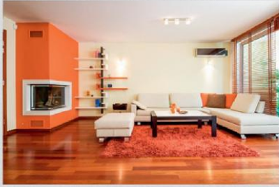
Privates Wohnzimmer, Glasvlies.

Ausstellungsraum. Alle gezeigten Produkte stammen aus der Dolwa-TEX-Produktlinie.